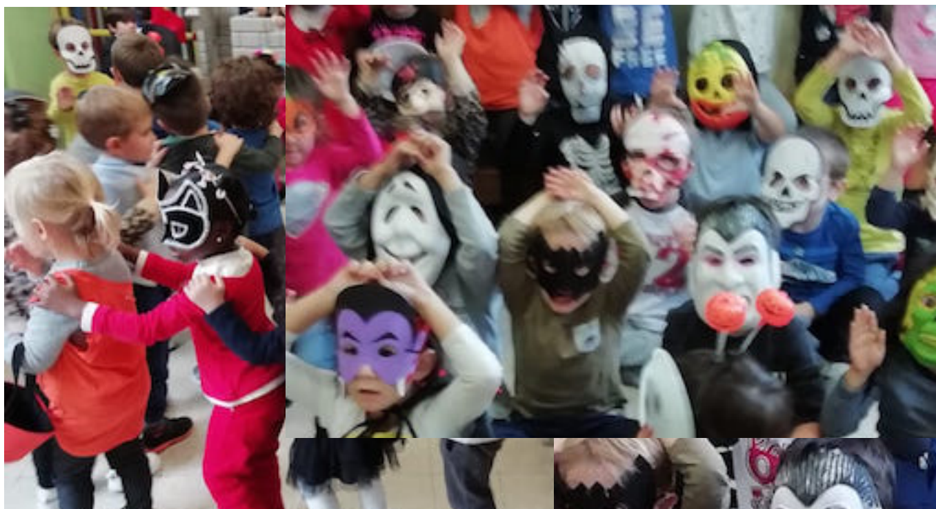
L'infanzia e i diritti dei bambini