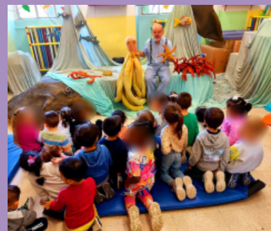
Magia del Teatro all' Infanzia Dante